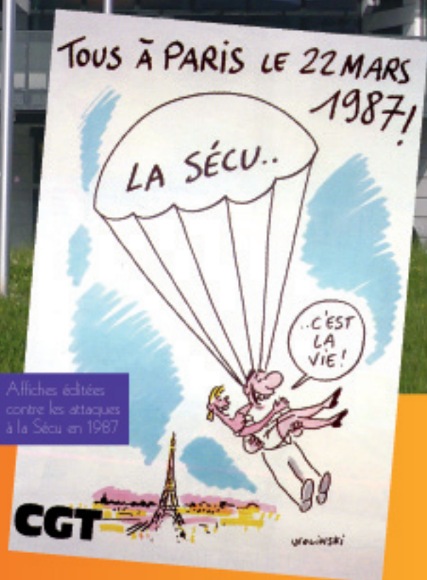
Alfiches éditées contre les attaques à la Secu en 1987

HOPITAL AVICENNE NON AUX PERTES D'EMPLOIS BAÏL A GEDER PRIVATISATIONS - FUSIONS SAUVONS NOTRE HOPITAL PUBLIC ENSEMBLE CGT SUD DES MOYENS POUR LA SANTE ET LES SERVICES PUBLICS